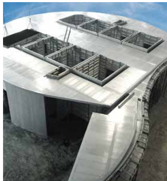
▲ La adaptación exacta a los requisitos específicos del proyecto elimina el trabajo de ajuste en el sitio y acelera el tiempo de montaje.