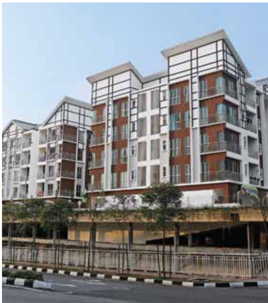
▲ Cameroon Highlands, Summer Square, consta de una planta baja y edificios de departamentos de tan solo 4 pisos con tiendas minoristas a nivel del suelo. Las unidades de las tiendas se colaron en primer lugar y las losas de los departamentos se finalizaron a un ritmo de un piso cada 5 días.