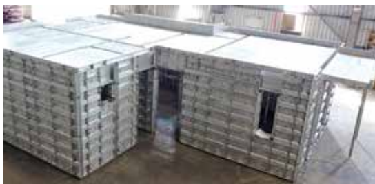
▲ Doka Monolithics producido por MFE es un encofrado de alto rendimiento diseñado para encofrar muros y losas rápidamente en una sola pieza.

La estructura resultante es extremadamente fuerte, muy precisa y logra un acabado a la vista de alta calidad con solo un mínimo de "capa delgada" requerida para el acabado final de la superficie. Usando el sistema, nuestros clientes pueden aumentar considerablemente la velocidad de la construcción de edificios de gran altura construidos con un rendimiento de 4-5 días por piso e inmuebles construidos a un ritmo de una casa por día usando un solo conjunto de encofrados. Los sistemas de encofrado de aluminio MFE pueden ser operados por trabajadores no calificados y no requieren herramientas o equipos especializados.