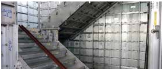
▲ Gracias al montaje de prueba, podemos garantizar en todo momento la configuración correcta del sistema, especialmente para áreas especiales como escaleras, paredes con formas especiales, etc.