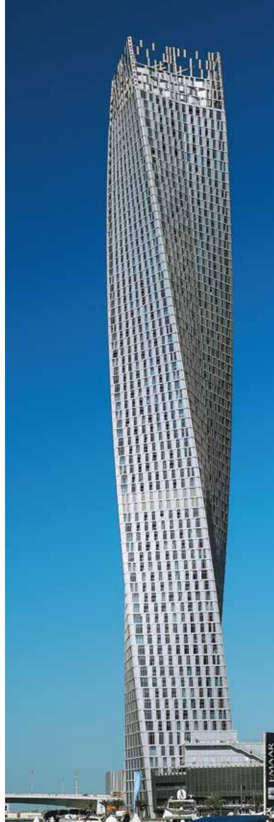
▲ The Cayan Tower, un lujoso edificio de apartamentos con una forma helicoidal sorprendente, que gira 90 grados en el curso de su altura.