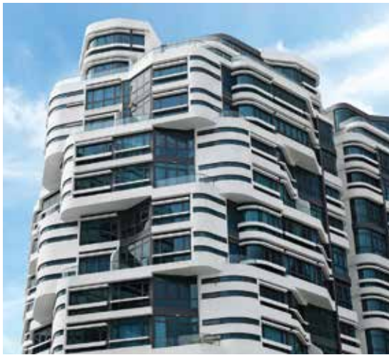
▲ Armonioso edificio residencial multigeneracional, donde se logró un objetivo de tiempo de ciclo de 5 días por piso debido a la solución de encofrado.