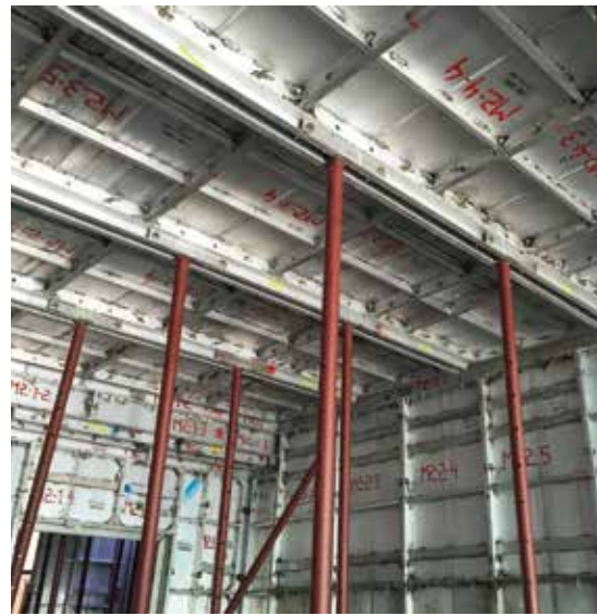
▲ Build smart: Doka Monolithics producido por MFE permite un encofrado altamente rentable logrado por un concepto de sistema lógico y adaptable.

El encofrado MFE se adapta fácilmente a todos los tipos de requisitos de encofrado de concreto, desde torres de oficinas, hoteles y condominios de gran altura, hasta casas de una o dos plantas y proyectos de viviendas asequibles.