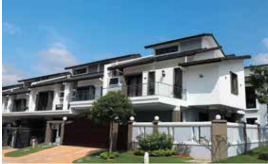
▲ 150 casas adosadas de gama media en el área de Shah Alam en Kuala Lumpur