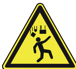
Caída de objetos