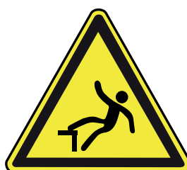
Caída a distinto nivel