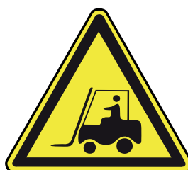
Tránsito de montacargas