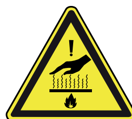
Contacto con superficies calientes