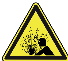
Proyección de partículas

Al ingresar a KUBIEC S.A. es necesario que identifique los principales peligros a los que se expone.