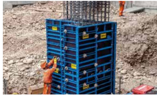
Se puede encofrar fácilmente incluso columnas con formas geométricas complejas