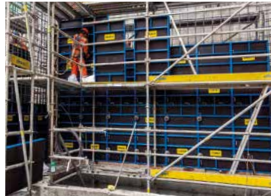
Encofrado rápido de muros gracias a un manejo sencillo